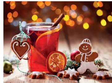
Weihnachtsmarkt am 2. Advent